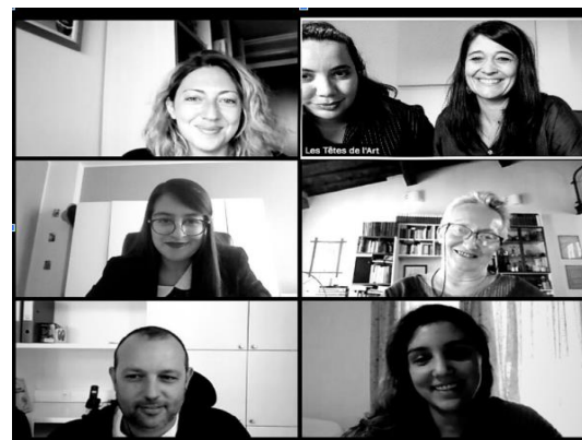
Photo: Meeting, Oct 2021

Das Projekt richtet sich an lokale Gemeinschaften, MigrantInnen, behinderte Menschen, Jugendliche, lokale und kommunale Organisationen, Jugendclubs/-zentren und NROs.